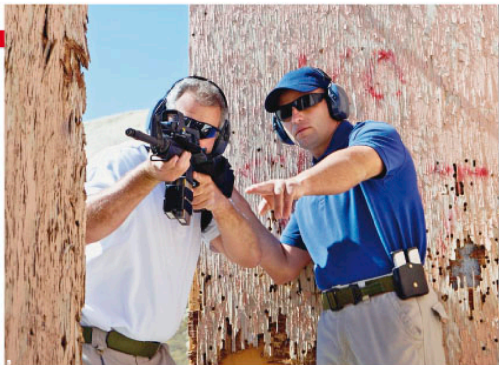
▲ OBRÁNCI. Statistika, kolik střílná zbraň zachránil v míru životů, se nevede. Počet případů je sota vyšší než množství vražd, sebevražd a neúmyslných zabití při „hře“, čištění zbraně nebo při lovu.

Střelce penzista z Tanvaldu v rozhovoru s novináři tvrdil, že lidé v jeho okolí si po lednovém incidentu začínají pořizovat zbraně, čísla, která by nějaký dramatický nárůst v Tanvaldě potvrdila či vyvrátila, ale nejsou k dispozici (policie poskytl pouze údaje o počtu žádostí za celé Jablonecko: do poloviny prosince jich bylo od ledna podáno 2380, za loňský rok kvůli „pře-