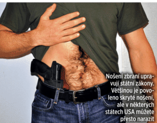
Nošení zbraní upravují státní zákony. Většinou je povoleno skryté nošení, ale v některých státech USA můžete přesto narazit

s krátkou hlavní, tlumiče) je zapotřebí zvláštního federálního povolení.