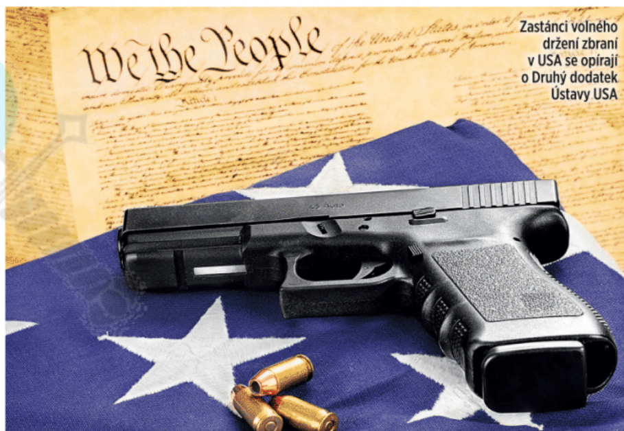
Zastánci volného držení zbraní v USA se opírají o Druhý dodatek Ústavy USA